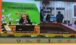
Best Nagar Palika Parishad Mirzapur