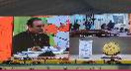
Best Nagar Panchayat Malihabad